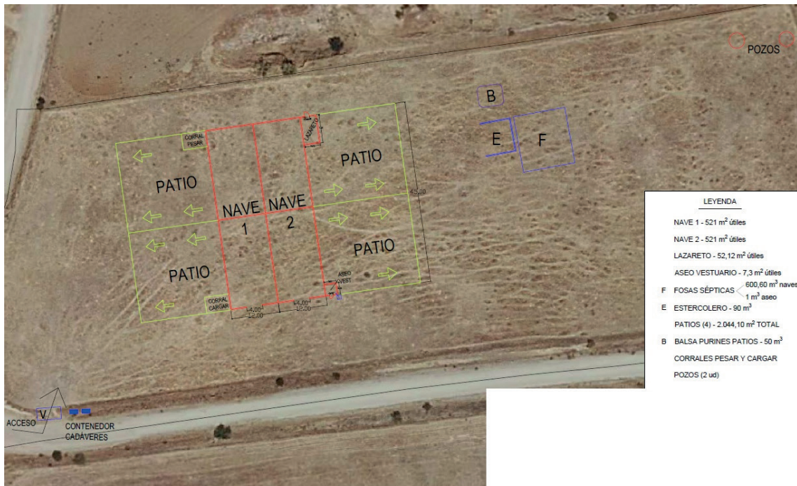
Fig.1. Vista general de las naves, patios de ejercicio e instalaciones auxiliares.